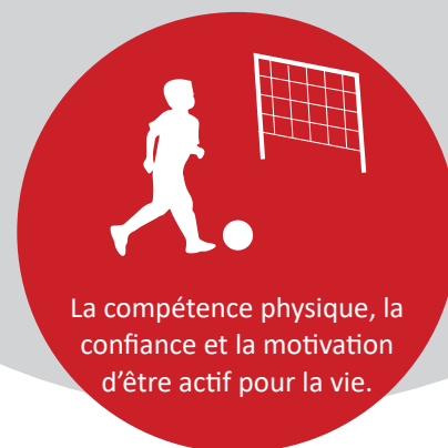
Figure 4 : Activité physique et littératie physique

parce que les habiletés motrices fondamentales sont une composante essentielle de la littératie physique